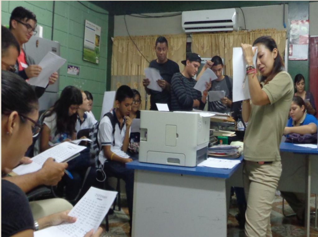
Primer encuentro: 9 mayo 2017