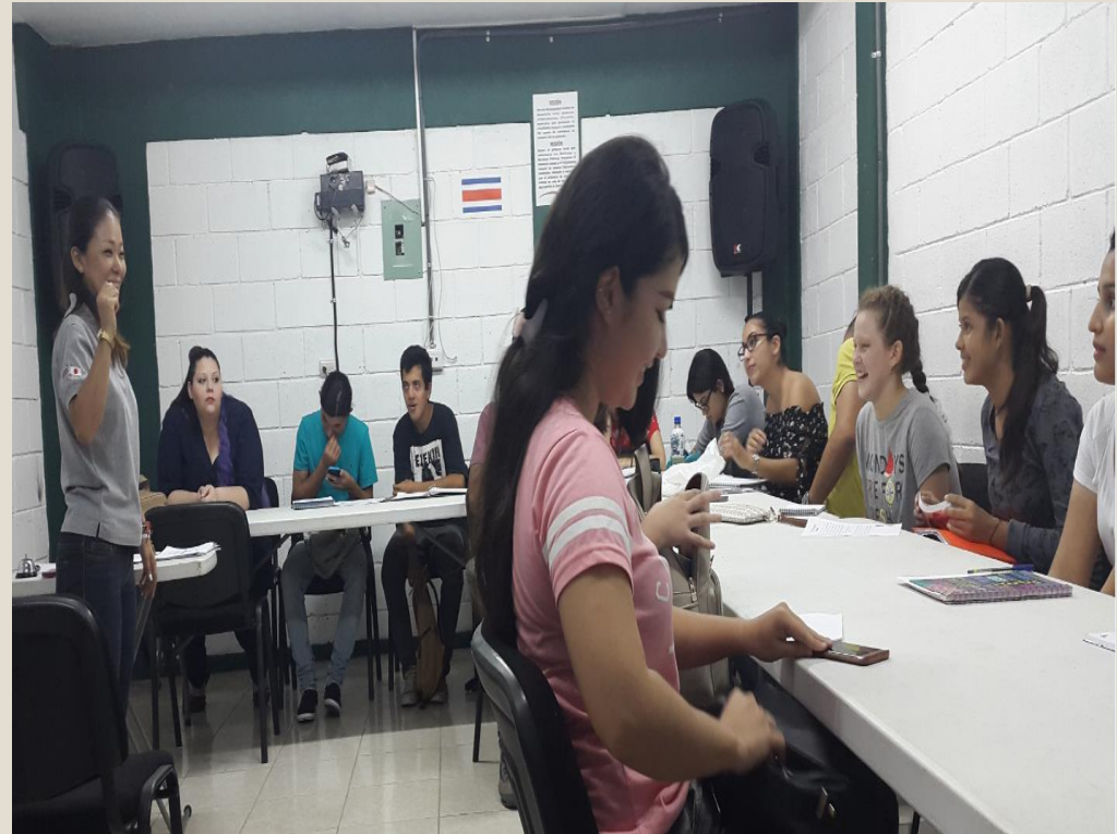
16 mayo 2017