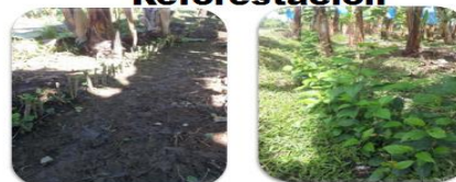
Alrededores de las fincas