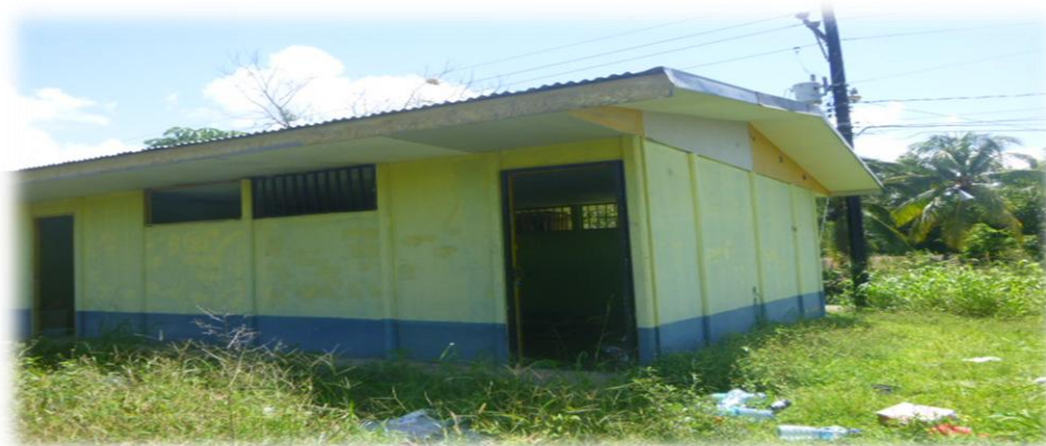
Parte frontal hacia la cancha, no existen puertas en los camerinos, se las robaron

Estos camerinos se encuentran en una zona de alto riegos, se robaron las puertas, los aires acondicionados y los servicios sanitarios con esto quiero decir que el monto de los ¢3.310.557,90; se utilizo en la remodelación y en este momento todo ese dinero se perdió porque las instalaciones están en deterioro completo, como lo demuestran las fotografías que les adjunto.