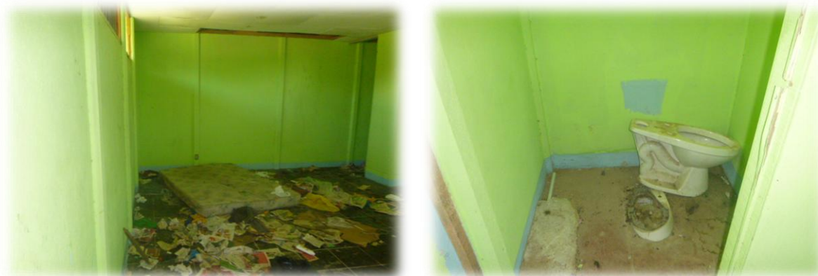
Camerinosy baños por dentro, son guarida de indigentes, es un lugar nauseabundo y sucio.