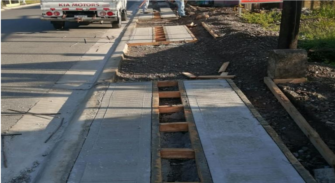
6-10-098 (Rio Nuevo)